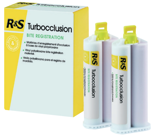
En comparación con los productos de la competencia:

"HE TENIDO MENOS AJUSTES CON REGISTROS DE MORDIDA TURBOCCLUSION R&S."