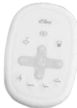
Panel táctil estándar