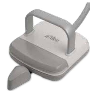
Control de pie con palanca