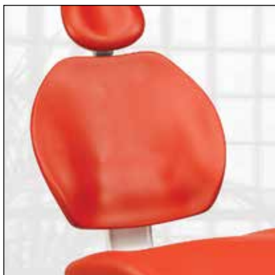
Tapizado sin costuras, sin apoyabrazos