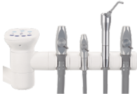
Soporte de 4 posiciones