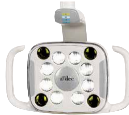
LED A-dec 500