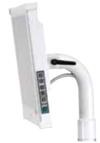
Montaje del monitor Radius