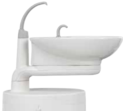
Escupidera de porcelana vidriada giratoria