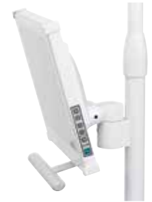
Montaje del monitor con luz