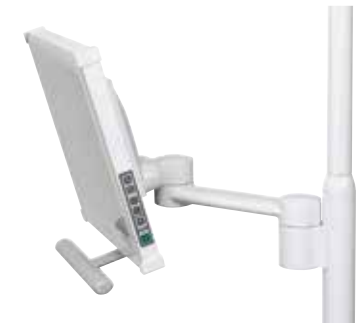
Montaje del monitor con luz con brazo de enlace