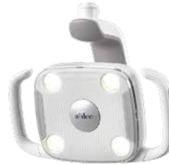
LED A-dec 300