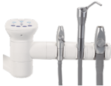
Soporte de 3 posiciones