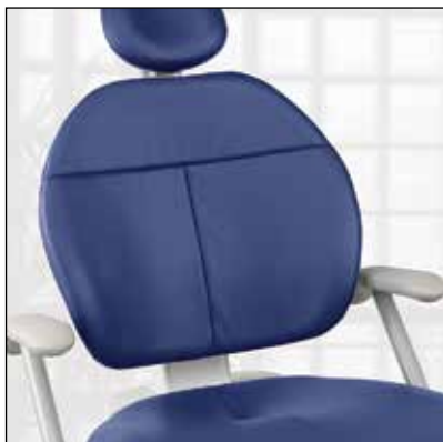
Tapizado cosido con apoyabrazos