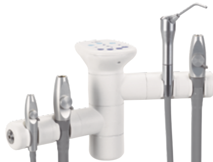
Soporte doble de 2 posiciones