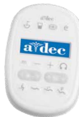
Panel táctil de lujo