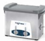
Highea 3 LAVADO