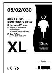
EJEMPLO DE PRESENTACIÓN