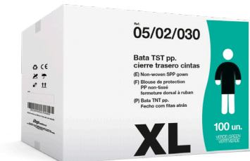
EJEMPLO DE PRESENTACIÓN