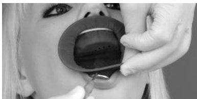
Fig. 3: Após o seu correto posicionamento atrás dos cantos da boca, o anel interno deve ser conduzido para trás dos lábios superior e inferior.