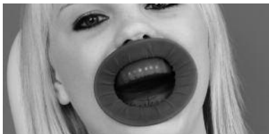
Fig.1: OpraDam Plus posicionado.