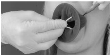
Fig. 2: Correta apreensão do anel interno, com os dedos polegar e médio. Neste processo, o anel é ligeiramente comprimido.

Quando apreender o anel interno, não permitir que ele seja totalmente deslocado da bolsa de látex.