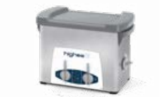
Highea 3 LAVADO