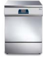
Tethys T60 - Tethys D60