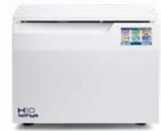
Tethys H10 plus TERMODESINFECCIÓN