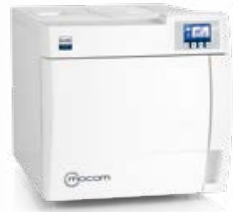
B Classic AUTOCLAVES