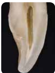
Prof. Marleen Peumans (Belgica)

Los sistemas de color tradicionales confían en diferentes tonos (colores), conocidos como A, B, C y D. Sin embargo, se sabe que el esmalte y la dentina tienen características diferentes y que ambos contribuyen a la percepción de color final del diente. Si rompe con los colores monocromáticos tradicionales y se centra en la reproducción de las características del esmalte y la dentina , podrá obtener un resultado mucho más natural con solo dos capas.