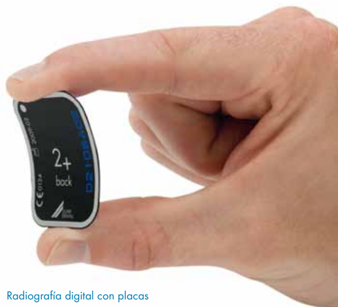
Radiografía digital con placas radiográficas: no hay nada más flexible

Las impurezas en las placas radiográficas se aprecian en la imagen y reducen la vida útil. La toallita para limpiar placas radiográficas VistaScan limpia las placas a fondo y a la vez las desinfecta. Ventaja: la calidad óptima de la imagen se conserva durante mucho tiempo.